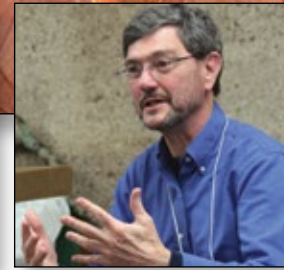
Listening and learning