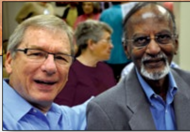
Guidance from mentors