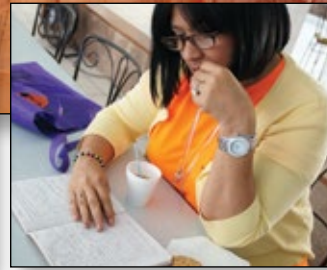
Study and growth