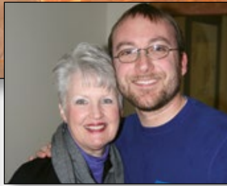
Deepening relationships and community