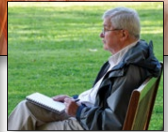
Silence and Reflection